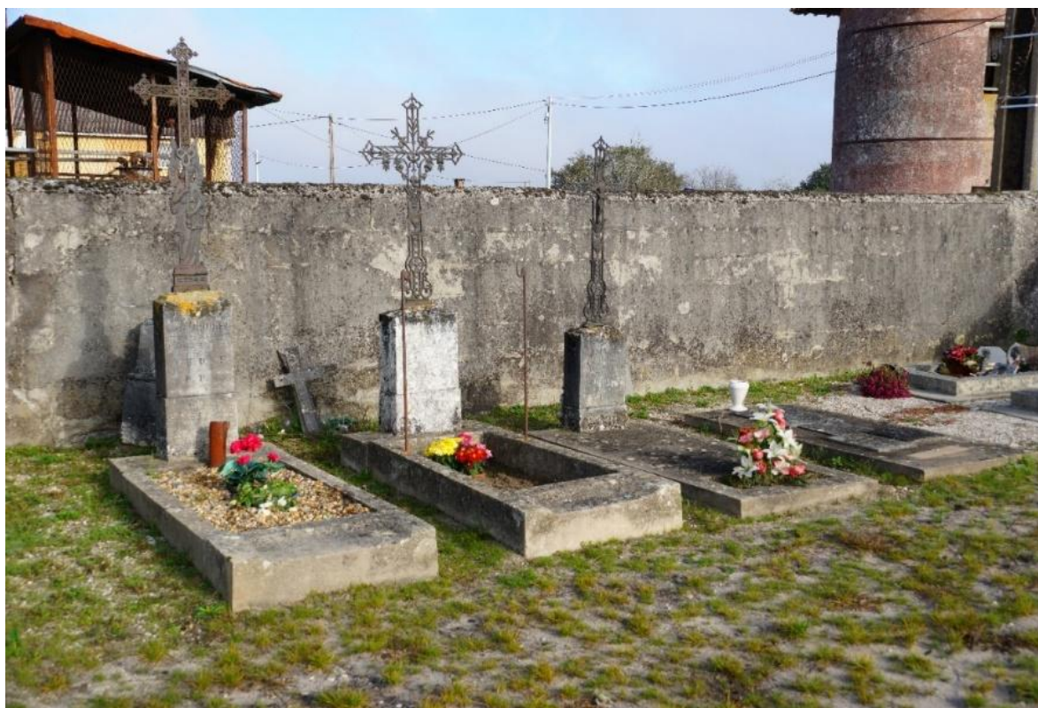
Dans l'angle nord-est du cimetière de Listrac, quelques tombes de soldats victimes de la guerre 14-18, sont regroupées. C'est peut-être là que se trouve la concession perpétuelle.

Le Conseil du 2 juin 1921 décide, à l'unanimité, d'accorder une concession à perpétuité dans le cimetière communal à tous les corps des soldats « Morts pour la France ».