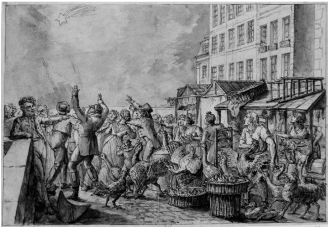
Caricature sur la comète de 1811 (en haut à gauche). Dessin à la plume et lavis de Claude-Louis Desrais (1746-1816)

C'est en septembre qu'elle fut la plus brillante, visible au moment de la fleur de la vigne et jusqu'aux vendanges, la fameuse comète marqua un été et un automne anormalement chauds en Europe. La production de vins fut exceptionnelle en qualité et en quantité dans tous les vignobles. D'un point de vue oenologique et de mémoire d'homme, aucun millésime n'a égalé le 1811 dont le passage de la Comète a bel et bien consacré la naissance de chefs-d'oeuvre: les Vins de la Comète.