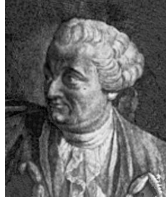
Cassini de Thury