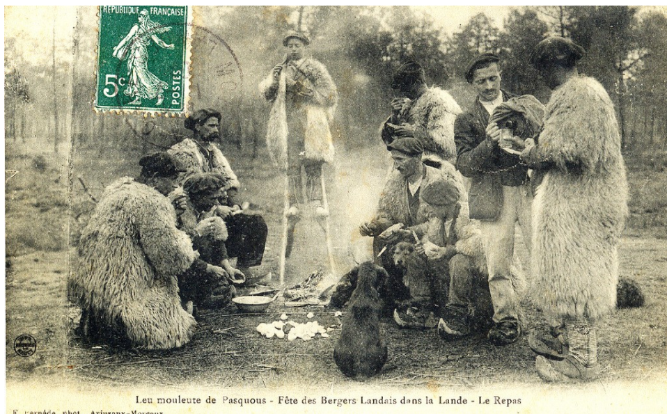
Lou mouleute de Pasquous Fête des bergers landais : repas dans la lande

Pendant les 40 jours maigres du Carême, les oeufs sont proscrits et finissent donc décorés à défaut d'être mangés ! Et durant la semaine sainte commence la ronde des oeufs : selon les pays, la tradition en Europe veut que l'on collecte dès le jeudi saint tous les oeufs qui serviront à la confection d'omelettes gigantesques le jour de Pâques. Ceux là étaient jadis bénis par l'Eglise, le samedi saint